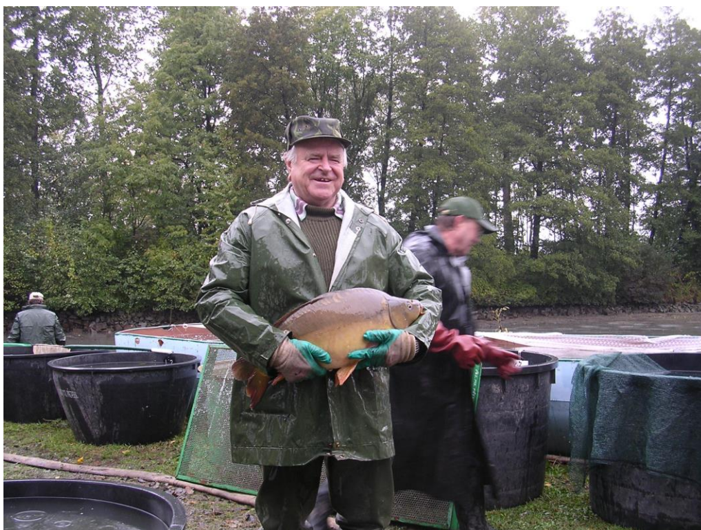
Vydala Místní organizace ČRS Přerov 2010